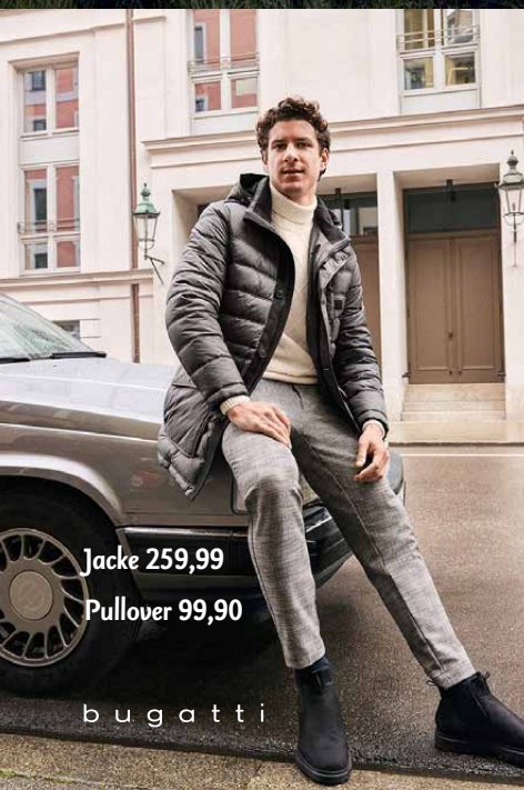
Jacke 259,99 Pullover 99,90