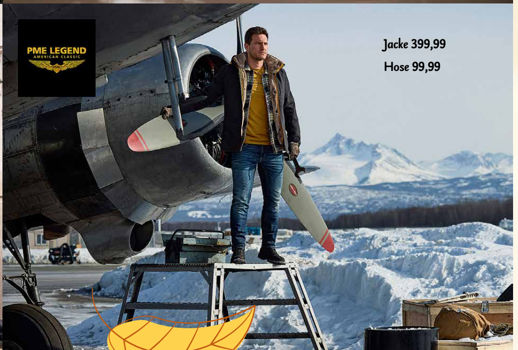
Jacke 399,99 Hose 99,99