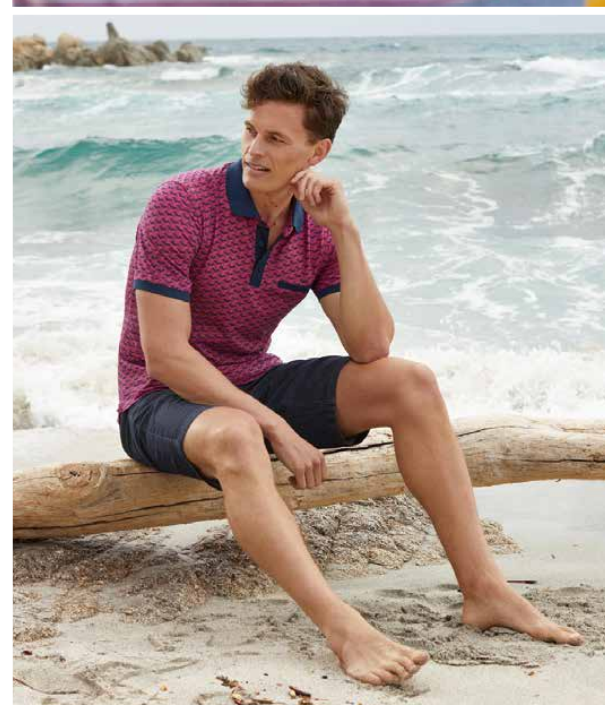
27533 | Poloshirt € 59,95 stay fresh® – das Original! bügelfrei, atmungsaktiv, hautsympathisch, trocknerbeständig