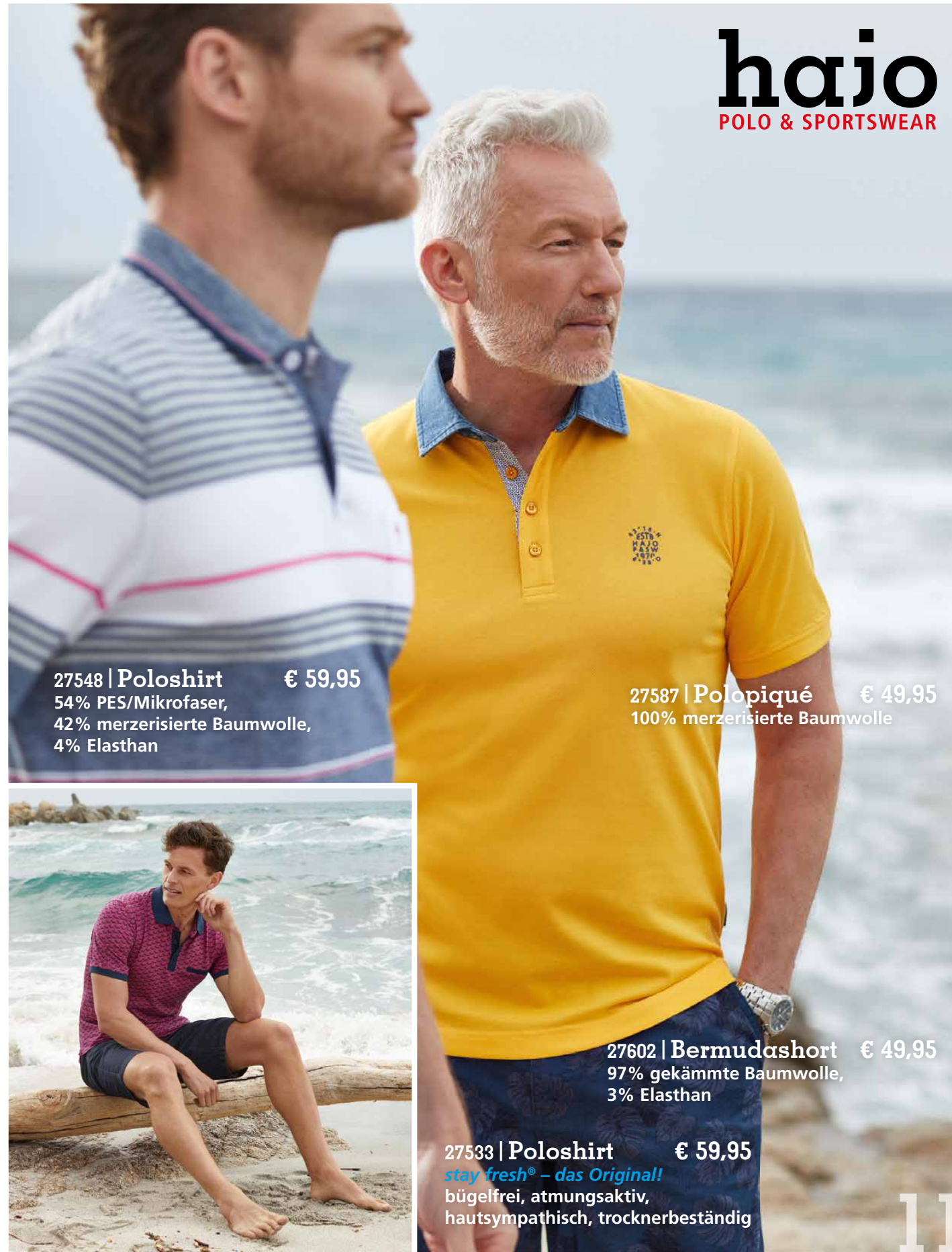
27548 | Poloshirt € 59,95 54% PES/Mikrofaser, 42% merzerisierte Baumwolle, 4% Elasthan