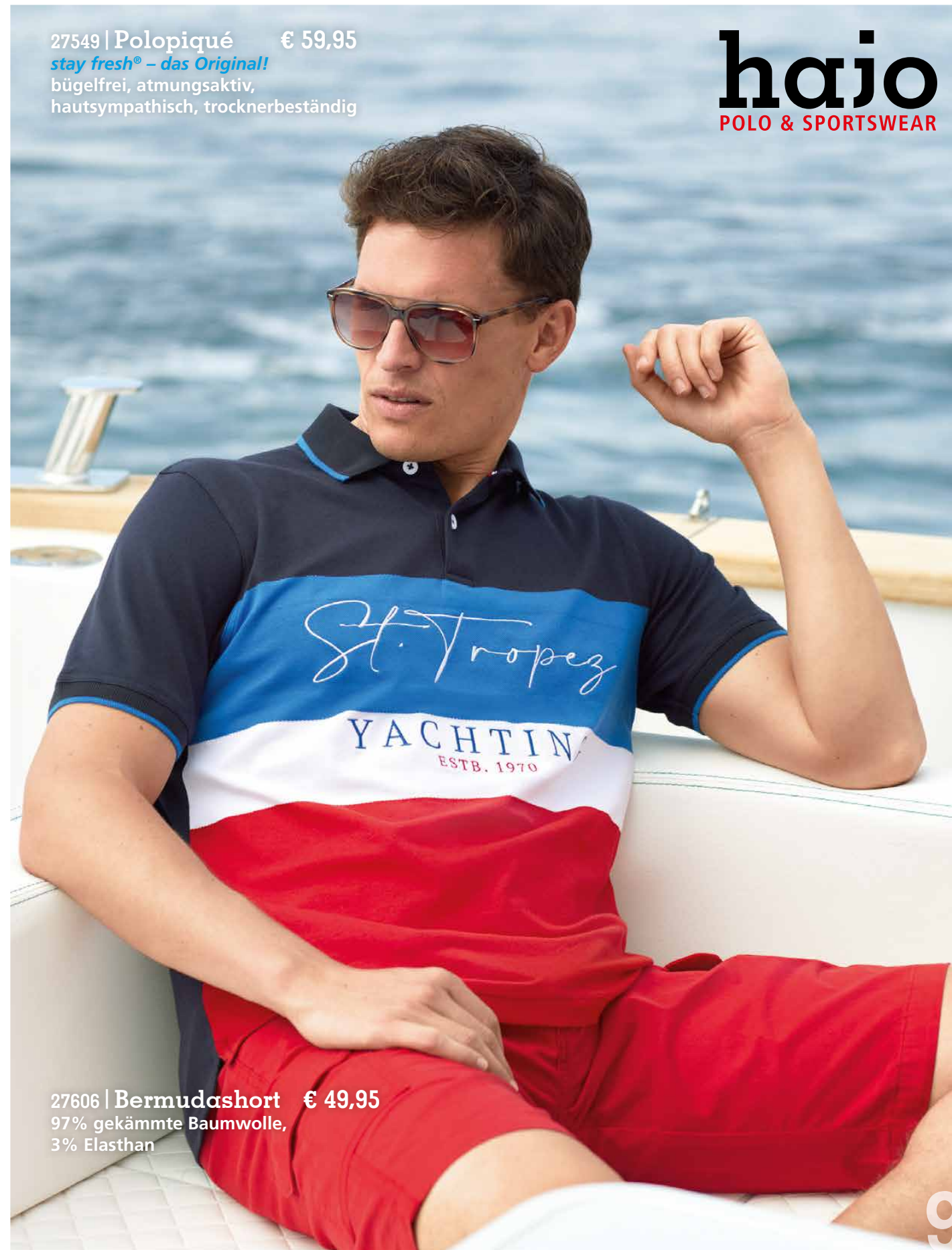
27549 | Polopiqué € 59,95 stay fresh® – das Original! bügelfrei, atmungsaktiv, hautsympathisch, trocknerbeständig