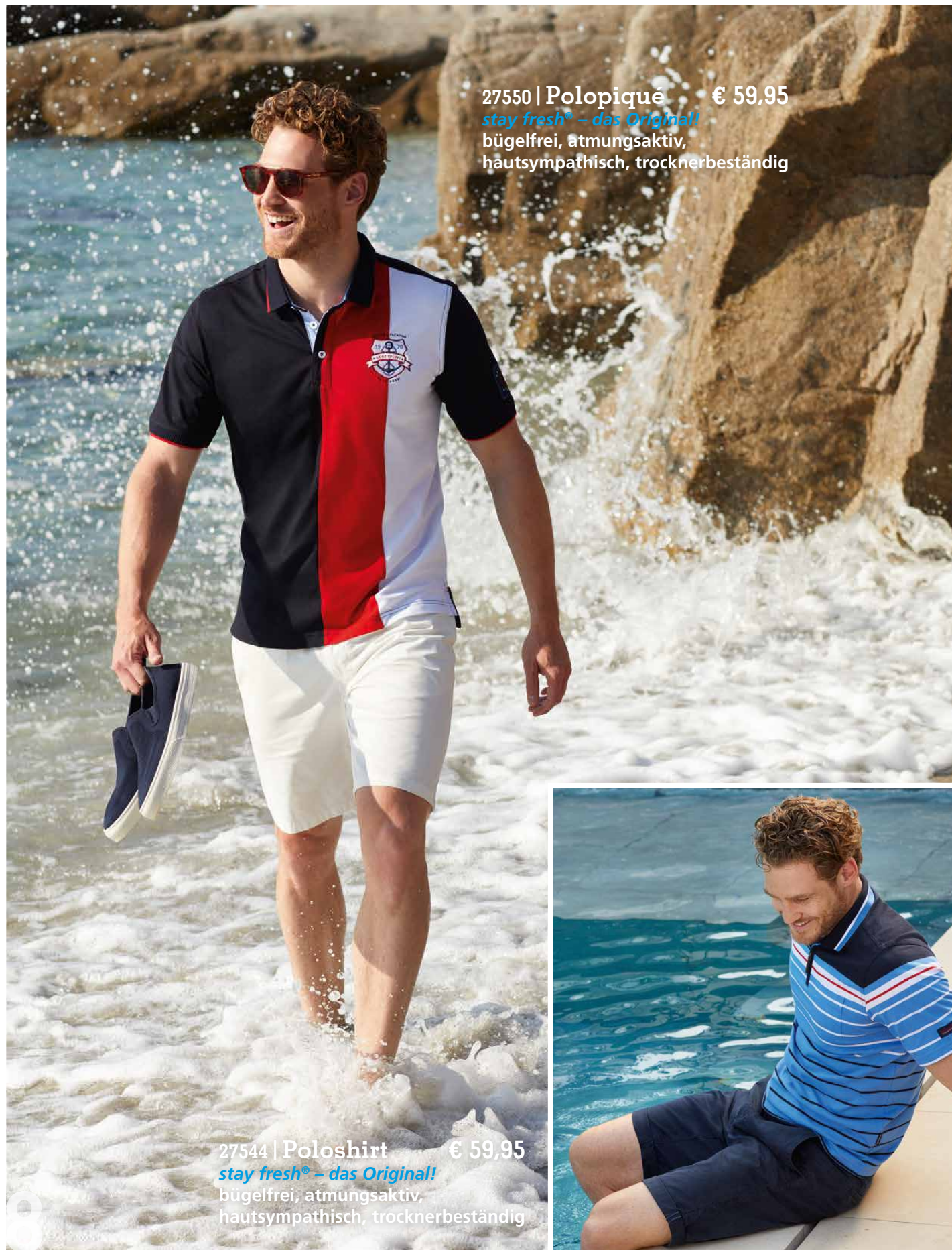
27550 | Polopiqué € 59,95 stay fresh® – das Original! bügelfrei, atmungsaktiv, hautsympathisch, trocknerbeständig