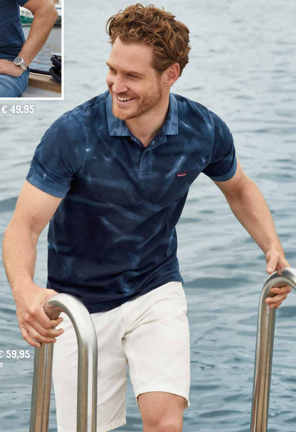
27569 | Poloshirt € 59,95 100% gekämmte Baumwolle