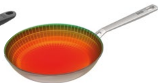
CULINARY FIVEPLY BRATPFANNE