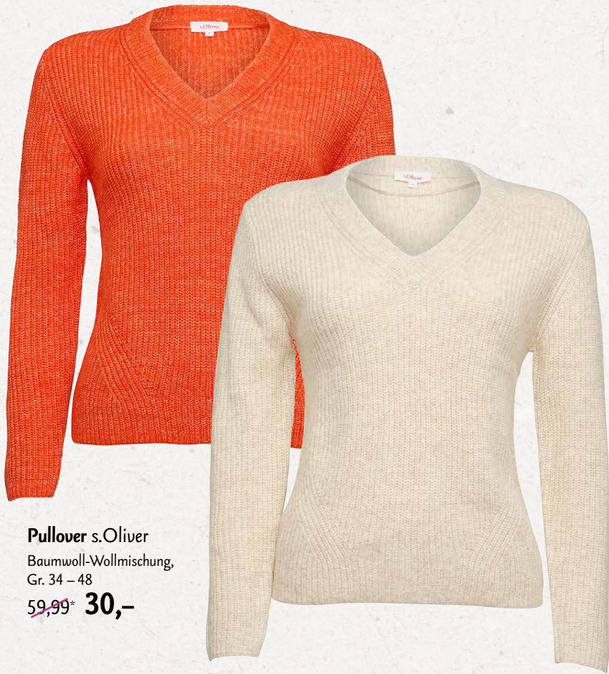
Pullover s.Oliver Baumwoll-Wollmischung, Gr. 34 – 48 59,99* 30,-