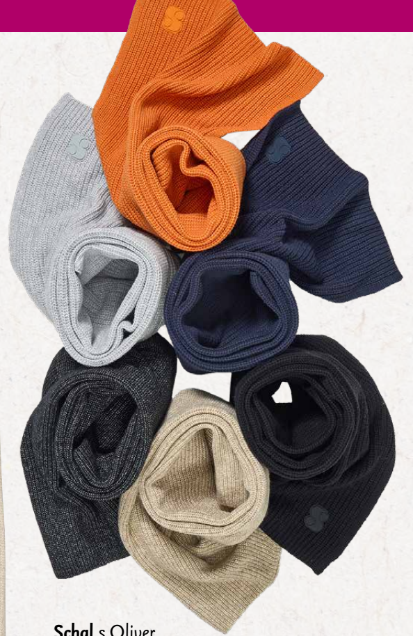
Schal s.Oliver one size, 55 % Baumwolle, 20 % Viskose, 20 % Polyamid, 5 % Wolle 35,99* 10,-