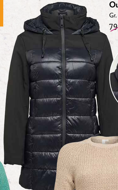
Outdoorjacke Only Gr. S – XXL 79,99* 39,-