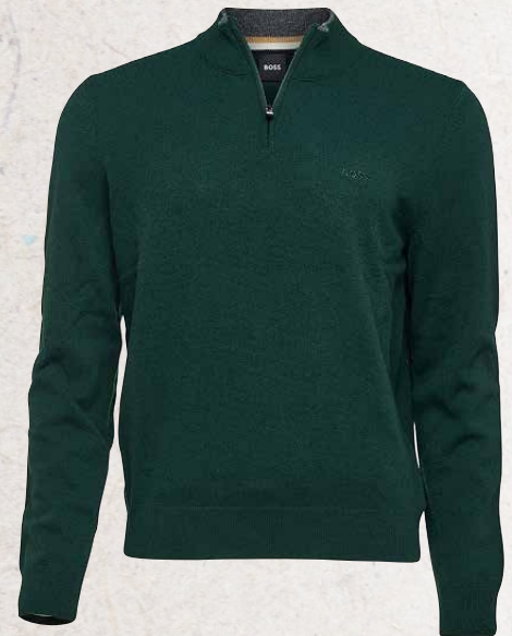
Troyer Hugo Boss