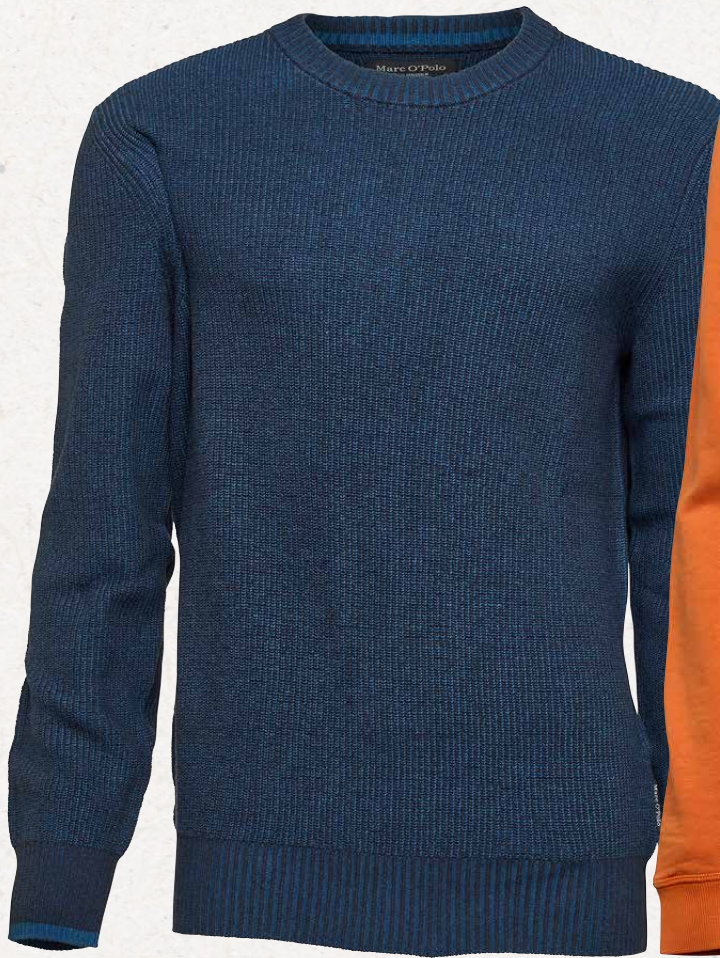
Pullover Marc O'Polo

Mischgewebe aus Wolle und Baumwolle, Gr. M – XXL