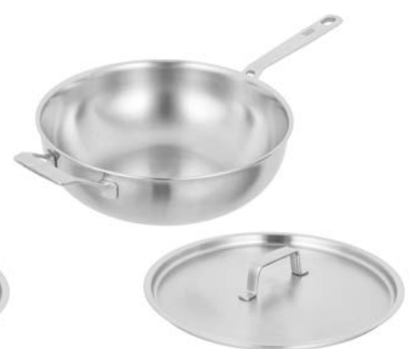
CULINARY FIVEPLY WOK UNBESCHICHTET

Der Star der asiatischen Küche jetzt mit fünf Schichten für noch gelungenere Kreationen. Stets bereit für die nächste Reise in die Küchen ferner Länder.