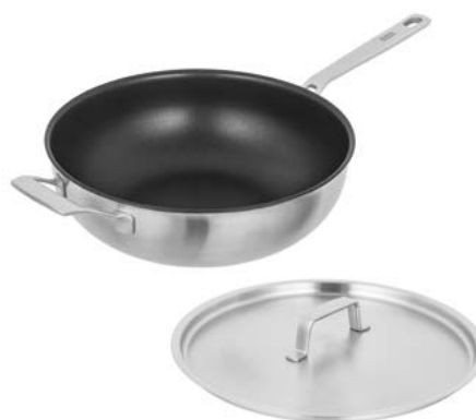
CULINARY FIVEPLY WOK BESCHICHTET

Erleben Sie Curries und Co. auf einem völlig neuen Niveau. Der ideale Begleiter für das Entdecken fremder und exotischer Gerichte.