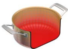
CULINARY FIVEPLY KOCHTOPF