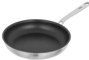
CULINARY FIVEPLY BRATPFANNE BESCHICHTET

Perfekte Wärmeverteilung ohne Angebranntes. Das Must-Have in Ihrer Küche.