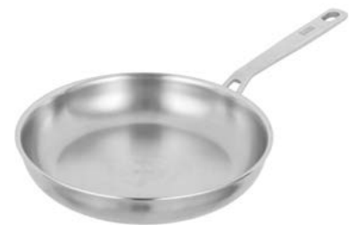
CULINARY FIVEPLY BRATPFANNE UNBESCHICHTET

Ø 20 cm UVP €69.90 38503 Ø 24 cm UVP €79.90 38504 Ø 28 cm UVP €89.90 38505